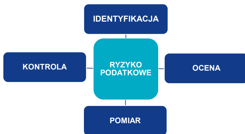
Schemat 1. Metodyka zarządzania ryzykiem podatkowym

Działania Spółki związane z minimalizacją ryzyka podatkowego można podzielić na cztery zasadnicze etapy: