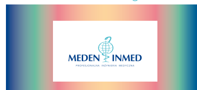
Logo na polu ochronnym w przypadku tła wielokolorowego