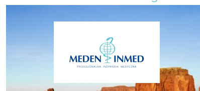
Logo na polu ochronnym w przypadku tła z grafiką